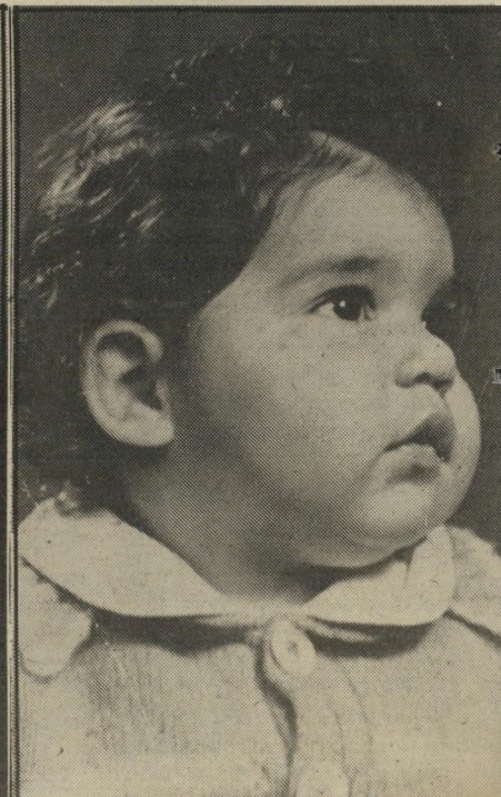
הוסמן את החגים ביליתי עם התימנים!