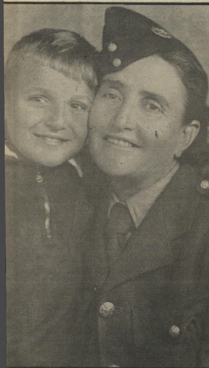
ביי-עז ואמו במדי הצבא הבריטי הילדים אמרו שאמא שלי ערבית!

הסב היה מבין 66 המישפחות הראשונות שיסדו את אחוות-בית. היה עובד-ציכוד של העדה הספרדית.