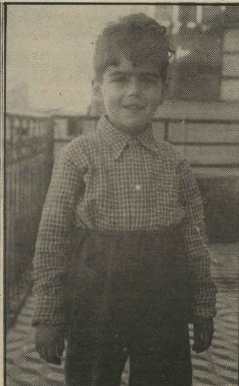
ברעם עד גיל 14 הצגתי את עצמי כספרדי!