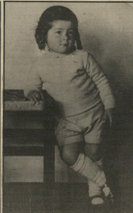
הנבי האשכנזים הטיפו לי יותר מוסר!