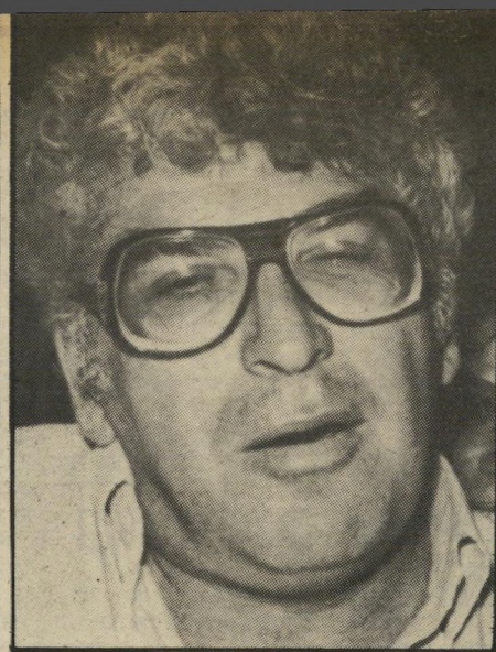
מירון בנבנישתי ליטא + יוון