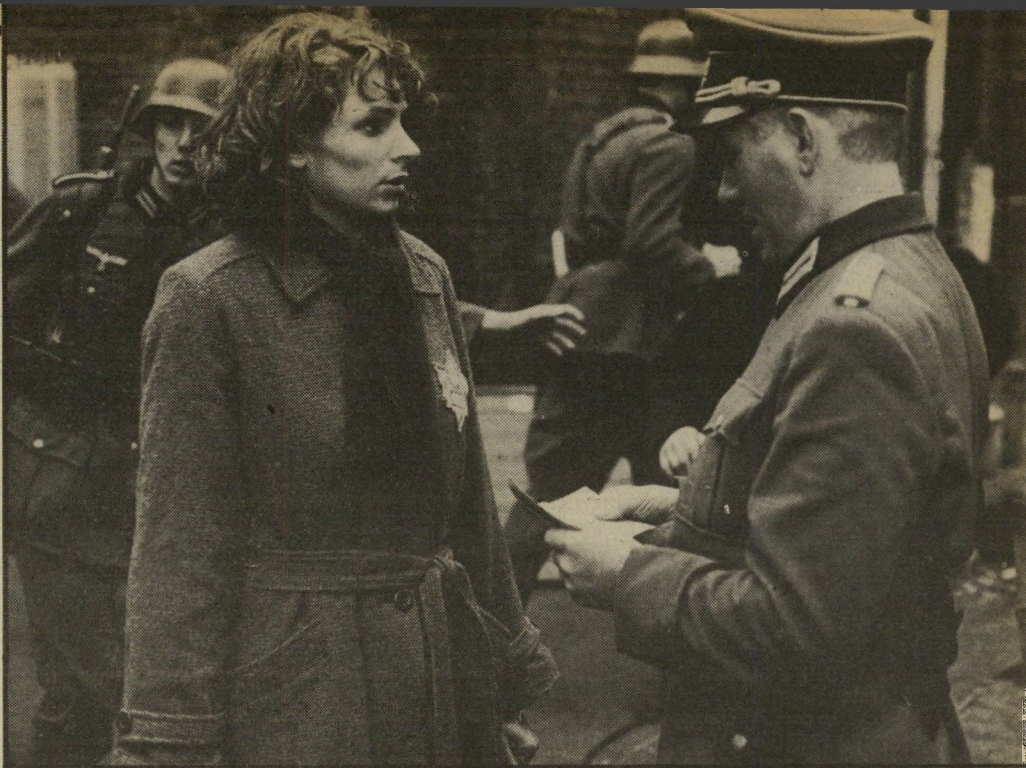
יהודי שאינו רחוב מגוריה. לקצין הנדהם היא מסבירה שאם לא תגיע הביתה עם רדת הלילה, יכונ אותה הוריה. התירוץ הזה משעשע עד כדי כך את הקצין הגרמני, שהוא מניח לה ללכת. שם הסרט: מתוק-מרי. הבימאי: קיס ואן-אוסטרומ. (1985).

אומנם, לכאורה נראה כי הנושא הכבד הזה, שהוא בכינוס קולנועי ראשון מסוגו, שייך לעבר הקרוב של אירופה. לאמיתו של דבר, נגע בלבי ליבו של העתיד המערפל בעולם כולו, ואין כמו העמים החיים היום במרחב אגן-הים-התיכון הסובלים עד עצם היום הזה מתוצאות העבר. שכן אחת