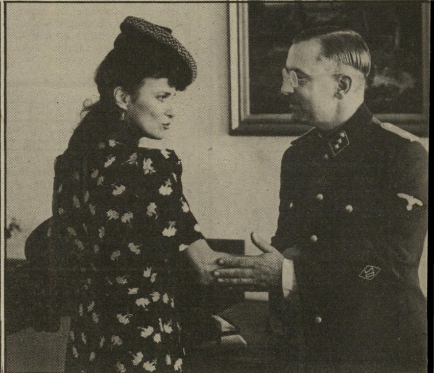
משחקים באש לוחמי-מחתרת הולנדי מתחזה כמשתפת-פעולה עם הגרמנים. כדי להפיל ברישתה קצין גסטאפו. הממונה על חקירתו של אחד מגיבורי-המחתרת המבוקשים ביותר על-ידי הגרמנים. היא מנסה למתות אותו במישרדו. כשהיא גורבת למנו גרבי-משי שנתן לה במתנה. אבל הוא, היודע שהיא אהובה. הטרוריסט" ההולנדי. נותן הוראה לאוסרה ולענותה. צל הניצחון (1986).