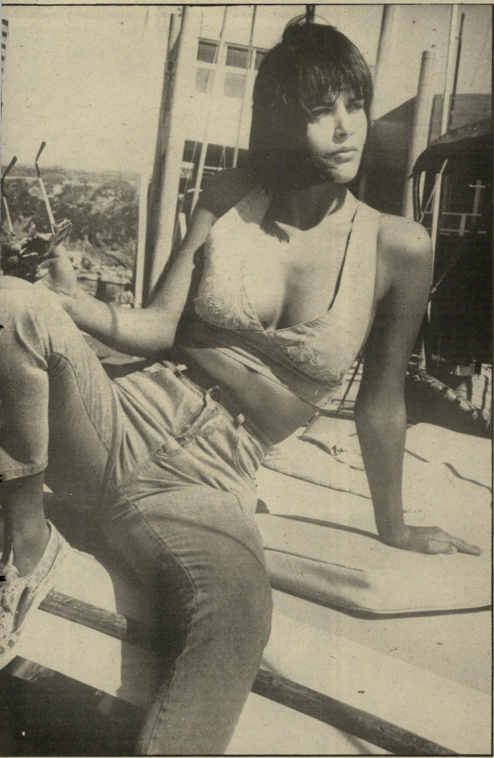
בד ג'נס, כשמשובל בו הדפס-ריקמה בגוון לבן. החולצות מתאימה לבעלות חזה שופע. את ההופעה ישלימו מיכנסי-ג'נס צמודים ונעליהתעמלות.