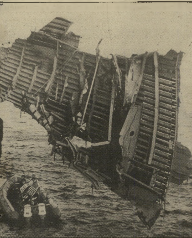
„ויפץ ה' אותם“ שרידי החללית „צ'לנג'ר“ נימשים מהאוקיינוס

ב עומדה מול האפשרות המעשית של התאבדות קולקטיבית שלא-מרעת, של רצח-הרדי שאינו אלא רצח-עצמי, נקרעת האנושות בין הטוב והרע אשר בקירבה פנימה. האנושות היתה תמיד מודעת למאבק פנימי זה. בתקופות קדומות היא מצאה סמלים חיצוניים לכוחות הטוב והרע אשר בתוכה. רוב המיתוסים של העמים משקפים מודעות זו. היהדות הקדומה לא הכירה בכוחהרשע עליון. האדם הרע, שייצרו רע מנעוריו,