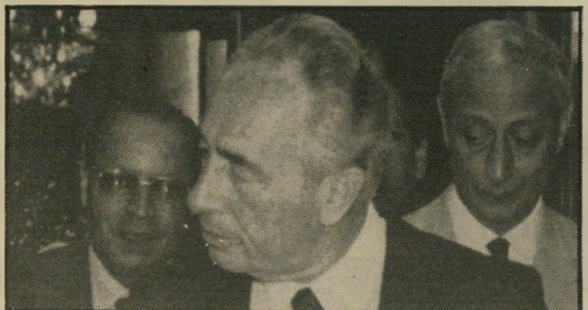
ראש-הממשלה יוצא פרס הוא מהלך על קרח דק

בעזה נדקר למוות איש תושבי-אשקלון. זהו אירוע כמעט שיגרתית. הסקרים האחרונים בשטחים הכבושים הוכיחו כי התנקשות בחיי ישראלים בגדה וברצועה מקובלת על כל חלקי האוכלוסיה, הרואה בה "התנגדות" לגיטימית לכיבוש. מבחינה זו אין הברל בין "מתונים" השואפים להסדר-שלום לבין אנשי-הסירוב.