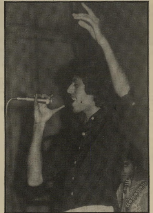
זמר שימי תמורי: אחרי הלחם בא הכבוד

היא נתנה לאנשים מנוכרים את הרגשת-השייכות.