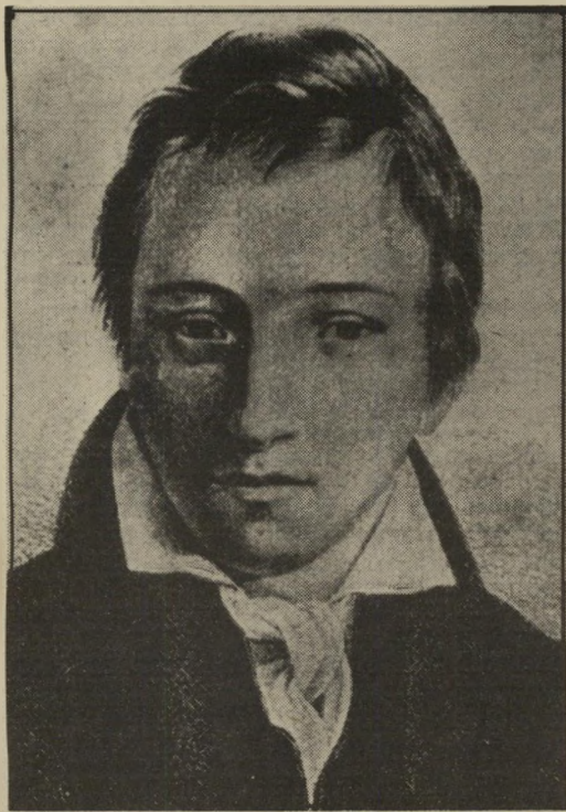
הוא כתב גרמנית: משורר היינריך היינה

צעירים אלה שואלים את עצמם: מניין באנו? מה היתה תרבות אבותינו? במה היא נופלת מתרבות אבותיהם של האשכנזים? האם עיירה במארוקו היתה נחותה לעומת עיירה בגבול פולין-רוסיה? האם פאס נחותה מפלונסק, בצרה מפשמישל, קאהיר מורשה? בחיפוש אחר השורשים נתקלים צעירים אלה בני-תון שאינם ניתן לשינוי: תרבות היהדות המיוזרחית משולבת בתרבות-ערב, בשם שתרבות היהדות המערבית (ליתר דיוק: המזרח אירופית) משולבת בתרבות-אירופה.