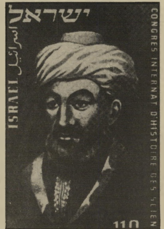
פילוסוף משה בן מימון: הם כתבו ערבית

היא נתנה לאנשים חלשים וחסרי-כספים הרגשה של כוח. היא איפשרה למדוכאים ולמושפלים לחוש בעליונות כלפי מי שמדוכאים ומושפלים עוד יותר, ואף להשתתף בדרכיו ובהשפלה. היא איפשרה ליהודים המיוזרחים לקבל מידי המימסד האשכנזי את הכבוד לכל דבר מיוזרח, ולהעביר את הכבוד הזה לזולתם — הערבים.