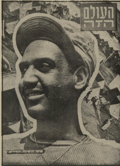
העולה החדש: איש-השנה תשי"א (1951)

למרות ההפליה החברתית, המתחילה עוד בגן-הילדים, ולמרות