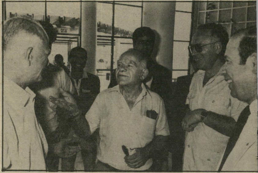
שמיר כאיש החבריא משוחח עם אנשי טבריה, נינוח על סיפון הספינה בכנירת: אדם בלתי-אמצעי, אינו מעוניין ביחסי-ציבור ובהצגות של חביבות