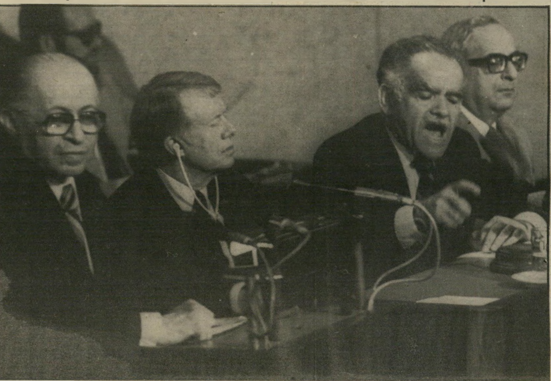
יו"ר הכנסת שמיר מנהל את הישיבה שבה נואם הנשיא קארטר (מימין הנשיא נבון)