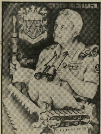
איש השנה תשמ"א שר-ביטחון שרון