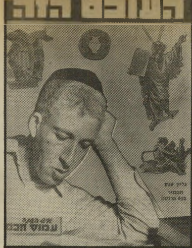
איש השנה תשי"ח חתר-תנ"ך חכם