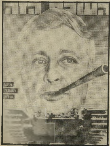
איש השנה תשל"א מקיס-ליכוד שרון