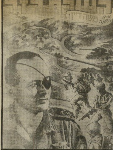
איש השנה תשי"ז מצביא-סיני דיין