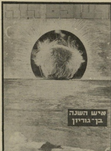
איש השנה תשכ"ז מתפטר בן-גוריון

קוּיָא יָקִי. בשער הגליון הבא יופיע — זו הפעם ה-36 — אישה-שנה של העולם הזה. זוהי ההודמנות האחרונה לערוך כמסיבת ליל-שבת את המישחק החברתי שכבר הפך למסורת: לבחור באיש (או באשה) שלרעת הנוכחים מסמל את מאורעות השנה יותר מכל אדם אחר, לטובה או לרעה — וגם לנחש מי יבחר עליידי העולם הזה. מבט אחד על 35 אנשי-השנה שעד כה פורש לפניך את כל ההיסטוריה של מדינת-ישראל. שלושה אנשים נבחרו פעמיים (דויד בן-גוריון, משה דיין, מנחם בגין), אחד שלוש פעמים (אריאל שרון). 12 הלכו לעולמם, מהם אחד נתלה (ארולף אייכמן), אחד התאבד (רוברט סובלן), אחד נפל בקרב (אריה רגב), אחד נרצח (ישראל קסטנר). רק שלוש פעמים נבחרה אשת-שנה (יעל דיין, גולדה מאיר, גאולה כהן). חמישה היו זרים (גמאל עבד-אל-נאצר, רוברט סובלן, ארולף אייכמן, הנרי קיסינג'ר, רוהאללה חומייני). מי הפעם?