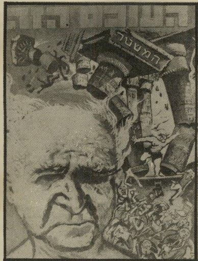
איש השנה תשכ"ה מפלג-מפא"י בן-גוריון