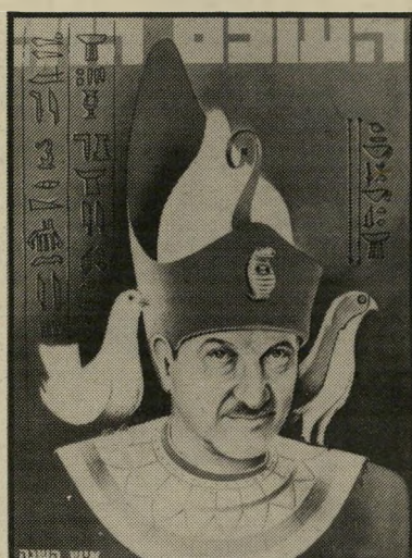
איש השנה תשל"ח שר-ביטחון וייצמן