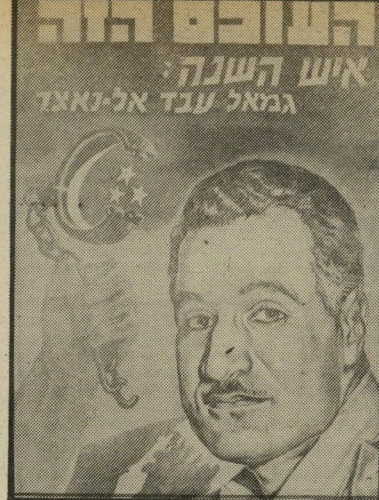
איש השנה תשמ"ז נשיא-מצרים עבד-אל-נאצר