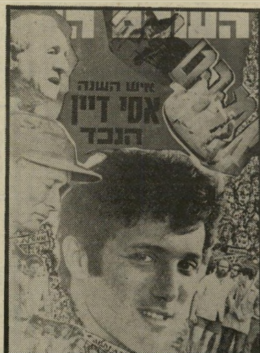
איש השנה תשל"א לוחם-שלום דיין