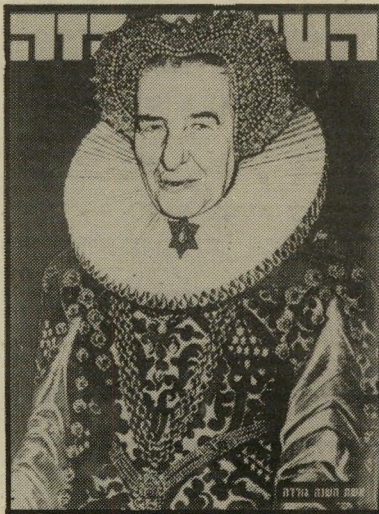
אשת השנה תשל"ב גולדה המלכה