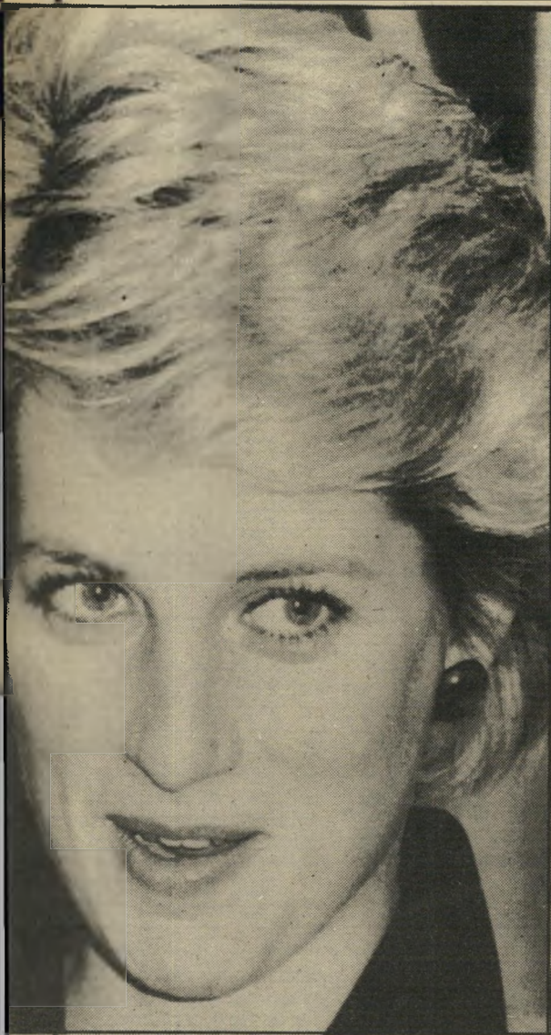
ליורי די - בגלל התיסרוקות המקורית?