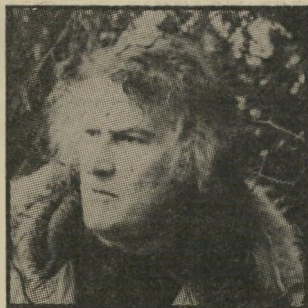
בימאי סולאנאס פרס מיוחד

קשה להאשים את מפיצייה רטים בישראל בזיוות יתרה: הסרטים הגדולים של פסטיבל ונציה, לי משל, מגיעים אלינו באיחור של שנה בדיוק, ואלה של קאן, בדרדכלל, לא הרבה יותר מהר. הנה, עוברת אורת של אייס וארדה, שזכה בפרס אריה הזהב של ונציה ב-1985. החל את הצגתו על ברזי ישראל בדיוק עם פתיחת פסטיבל ונציה '86. טאנגוס - הגלות של גארדל (העולם הזה פתח 17.9.86), שזכה לפני שנה באותו פסטיבל בפרס מיוחד של חברי השופטים, החל הציגותו כאן עם סיום פסטיבל ונציה '86.