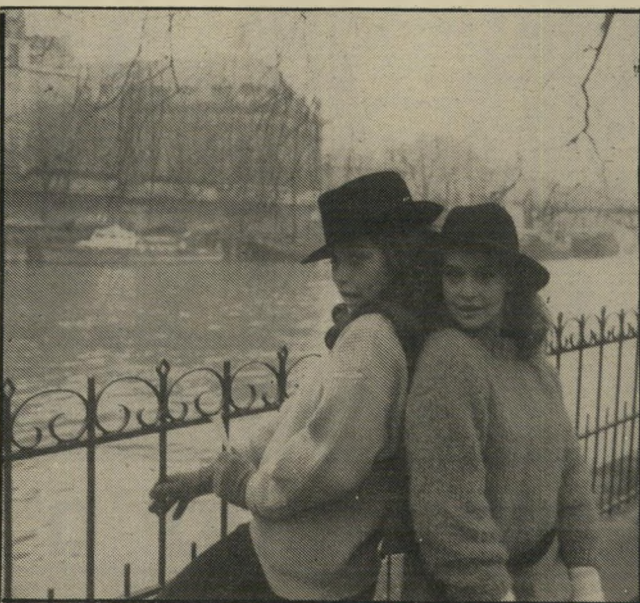
בנותיו של סולאנאס רוקדות על שפת הסינה בפאריס בין שתי תרבויות

סירטו. אבל הרי הוא לא היה כזה? וזה שם סימלי. גארדל, ממציא הטאנגו המזמר, זמר ומלחין שהפך את הטאנגו לתופעה בינלאומית בשנות העשרים והשלושים, לא היה גולה