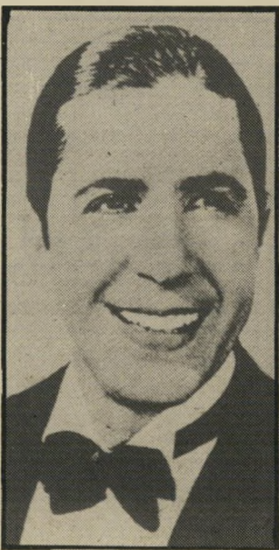
טאנגואיסט לואיס גארדל המיתוס של ארגנטינה

שהנשמה של הלאום הארגנטיני גלתה ממולדתה, בדיוק כמו גארדל, אשר חי את אחרית-ימיו הרחק ממולדתו. באופן טיבעי, וזה גם שמה של ההצגה שאותה מכינים המשתתפים בסרט שלי, הצגה שהיא מטאפורה