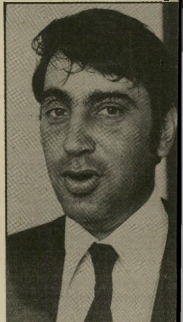
הפרקליט לעורך הדין מירווח קטן ביותר של תימרון.