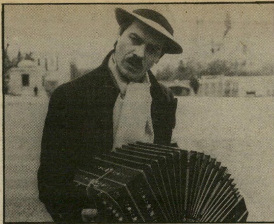
מיגואל אנהואל סולה: געגועים

בשיחה מבורכת, כשיכו שורשים במולדת החדשה? הבימאית סריטאי פרנאנדו סולאנס עשה לו שם בזכות סרטים בעלי קו פוליטי תקיף, שמאלני מובהק, כמו שעת הכיבושים או בנו של מרטין פרו, ונאלץ לגלות מארגנטטינה ב-1976. הפעם הוא נעזר בצלם יוצא מן הכלל, פליכס מונטי, ובמוסיקאי ארגנטיני מובהק, אסטור פיאצולה, כדי ליצור מחזמר-קולנועי מסוג חדש, מקורי ומקסים.