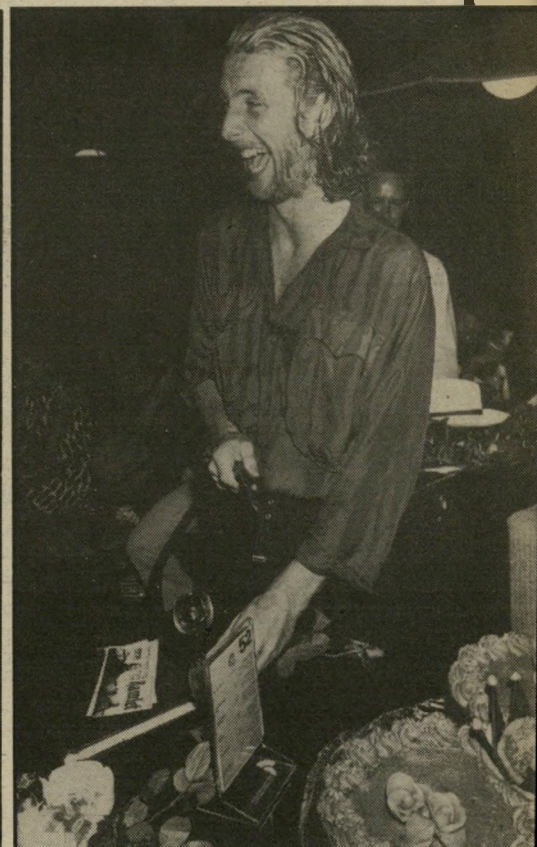
דייוויד טרלפול כוכב המחזה האמריקאי אוכספורד קומפני, הותך את עוגת הקרם.