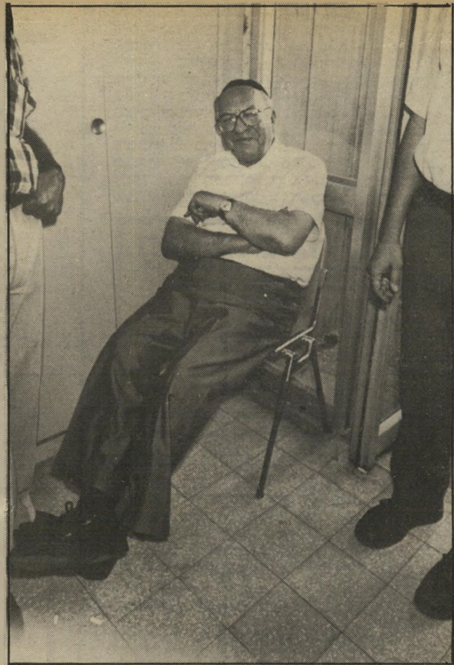
שר בורג אחרי המפלה לנתק את השר מצינורות החמצן