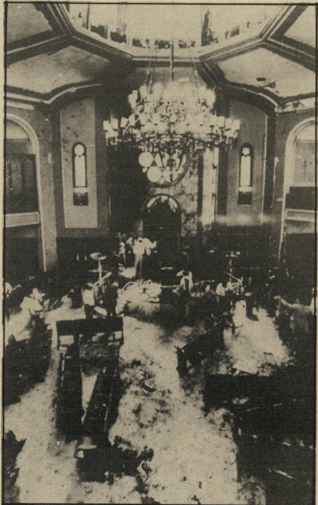
בית-הכנסת "נווה שלום" באיסטנבול אחרי הטבח על קודר

לכן מנה פרס עם הרוח והתחיל לפתע, לעשות שרירים. הוא נתן הוראה דרמטית לשני המנכ"לים בקאהיר: רודר קמחי ואברהם טמיר — לארוז את המונוודות ולחזור הביתה, אם המצרים לא יסכימו לתנאי ישראל בנוגע לסימון הגבול. כך הציג את