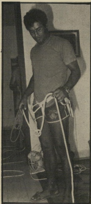
מטפס-צוקים הרני חתול או בראדס, אותו הדבר!

מכנייהאש סירבו ככל תוקף לשוב אל החתול. אהרון אשל, מפקד-התחנה, יש לי סולמות גבוהים. יכולתי להוריד את החתול, אבל למה שאתעסק בשטויות כאלה? זה לא החובה שלי? צער בעלי-חיים צריכים להתעסק עם זה, לא אני. אין להם ציוד מתאים? שיטפסו על העץ בלי ציוד. ובכלל, מה איכפת לי החתול הזה? מצידי שימות! יש לי לב רחום רק לכניי-אדם ולרכוש!