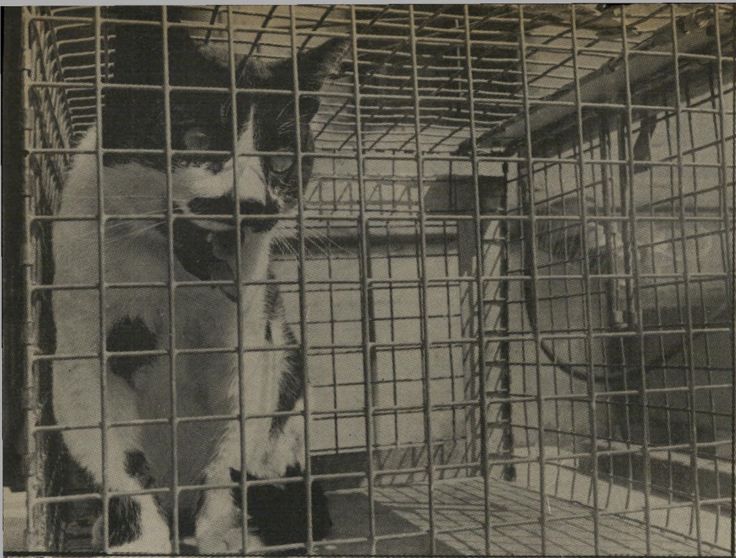
החתול האלמוני בבלוב צער-בעלי-חיים לא חבל, לא מים, לא קרשים, לא הרדמה

ב יום הראשון בכוקר התקשרו עם אגודת צער-בעלי-חיים.