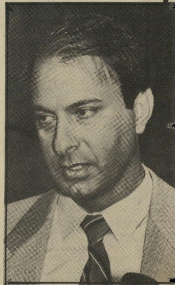
נאשם בלס מילחמה בלי מעצורים