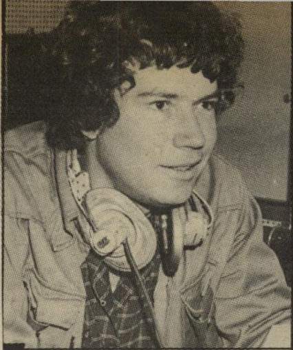
כתב סוקניק לא מעניין

מחלקת-החדשות של הטלוויזיה מבקשת להקים ועד-עיתונות עצמאי. בחדשות טוענים כי להם בעיות מיוחדות, שוועד עיתונות-הפקה אינו יכול לעזור בהן. גם הם טוענים למעמד מיוחד כמחלקת-החדשות בטלוויזיה.