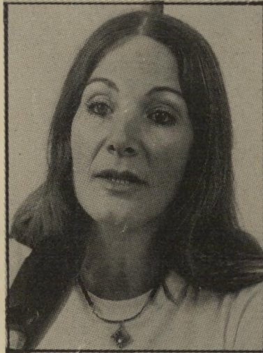
עזרת עברון לא לילדים קטנים

למרות הקשיים והמיכשולים שבדרך, הצליחה עברון להגיע אל קוראיה בצורה מכובדת