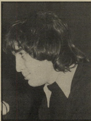
מגיש גפן בלילה

הצוות, שהתבקש לרונ בעמדות הצדדים, יחל את עבודתו השבוע. ככל מיקרה לא יקבל שר-