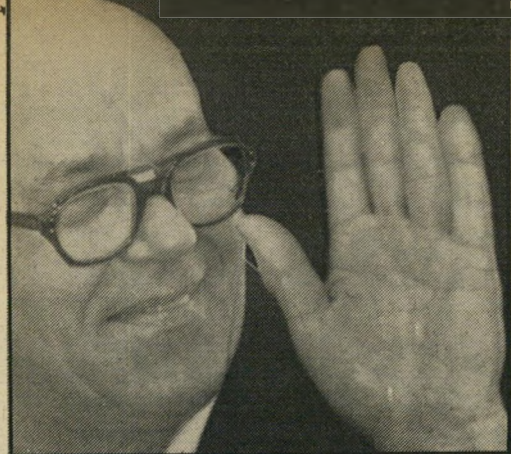
דמיאניוק (שער, "העולם הזה", 6.8.86) שני אנשים ביד אחת

כף-ידו מלמדת על שתי דמויות באדם אחד. כף היד והאצבעות מספרות על טיפוס אחד, ואילו הקווים על אדם שונה לחלוטין. לשתיהם כאלה בכף-היד אי-אפשר שלא להתייחס. לאצבעותיו צורה חרוטית (קונית), הנראית כמו אצבעונים שהוארכו. אצבעות חרוטיות מלמדות על אדם חביב, נוח, נעים וחברותי, מומחה ביצירת תיקשרות עם הסביבה. כלפי חוץ נראה כאדם בעל קסם וכישרון-שיחה בולט. הוא יכול לשבור את הקרח בכל מיפגש חברתי. מסוגל לדובב גם את זה הנחבא אל הכלים והביישן. בכל חברה שהיא הוא מתנהג בצורה מקסימה, אדיבה ומת-חשבת.