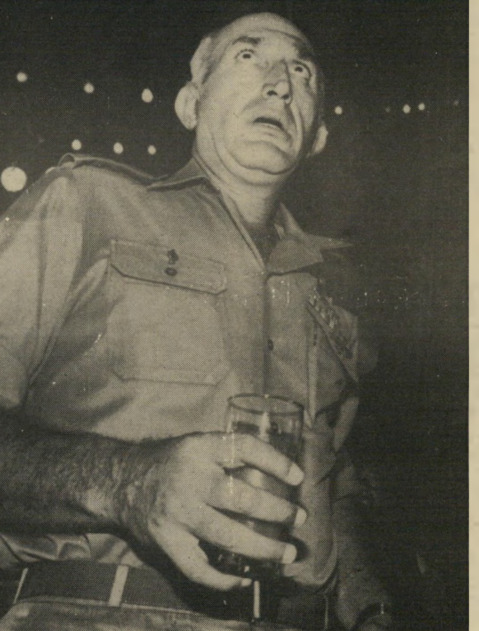
רמטכ"ל לוי אין צורך בדרג מדיני