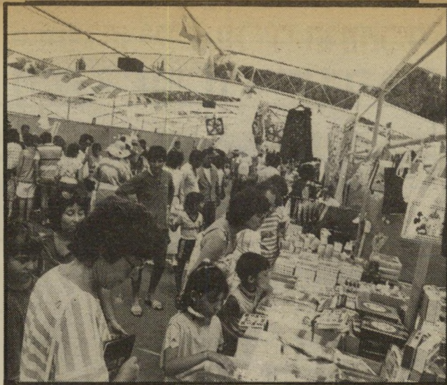
„רחוב“ בפישפשוך. לדפוק את הדתיים!

ועידה רצינית נערכת אחרי הכנה מרוקרת. פקידים משני הצדדים יושבים, מגבשים במשאומתן מפרך נקודות-הסכמה. אלה מנוסחות מראש. אז נערכת הפיסגה, ושני המנהיגים מכריזים באופן דרמטי על ההישג הגדול. הפעם לא נערכו שום הכנות כאלה. נסיעותיו של אברהם טמיר למובארכ נועדו לאירגון הפגישה עצמה, לא להכנת פריצת-דרך פוליטית גדולה. פרס עצמו התחייב לפני שמיר שלא לסטות מן ההסכם הקואליציוני, שאינו מאפשר שום תוויה, אלא במילים ריקות (פלטטינים אותנטיים). ערב עזיבתו את משרד-ראש-הממשלה בוודאי אין פרס יכול להתחייב לשום דבר ממשי, ומובארכ יודע זאת היטב. מובארכ, מצידו, אינו יכול לזוז מן