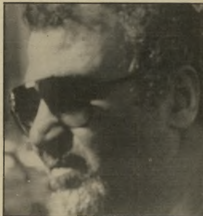
אביו של אלעזרוב בהלוויה עודד מעט יהפכו אותנו לרוצחים!

ב לילה נחלקת נתיים בקפדנות לחבורות. כל חבורה והעץ שלה, הרשא או הספסל המיוחד לה. כל חבורה שומרת על מקומה בקנאות, אינה מתירה פלישה של זרים לתחומה. עלייד המוסיאון.