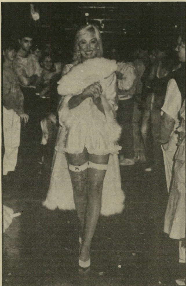
תצוגה בדיסקוטק „דן“ מתייחסים למוסיקה ולתקליטן