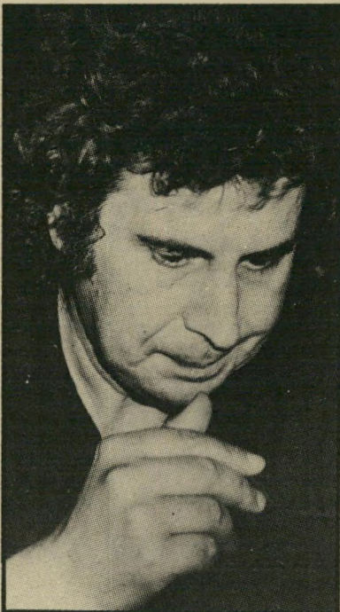
מלחין תאודורקיס בא

לקראת ביקורו של תיאודורקיס, תשרד מחלקת-הבידור כשבת הקרובה תוכנית על הומר היווני הלוחם. התוכנית תיקרא משירי המולדת