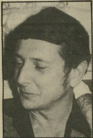
מבקר מוקד לא גאון

יש השיטה של עזרה לנהגת. שני חברה רואים שמתוך מכונת יוצאת אשה, כרגע היא מסתלקת מהמקום, ומחכים את אחר מצמיגי המכונת. היא רואה את הגלגל, ומייד אחר מהנשמות הטובות ניגש ומציע את עזרתו. בעודו מחליף את הגלגל ובעלת המכונת עוזרת לו, מסלק בך-זוגו את ארנק של