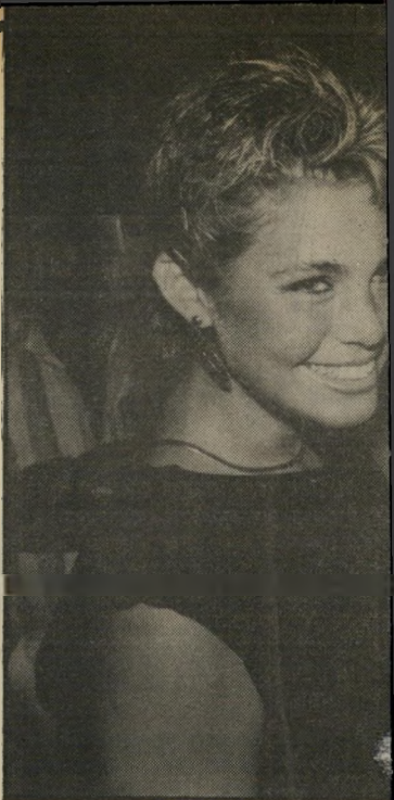
א ואשה לקבלן-בניין: היא מצוירת. בגדים. בתצלום, בחברת מלכת דוגמנית היפהפיה שימועה הולנדר.