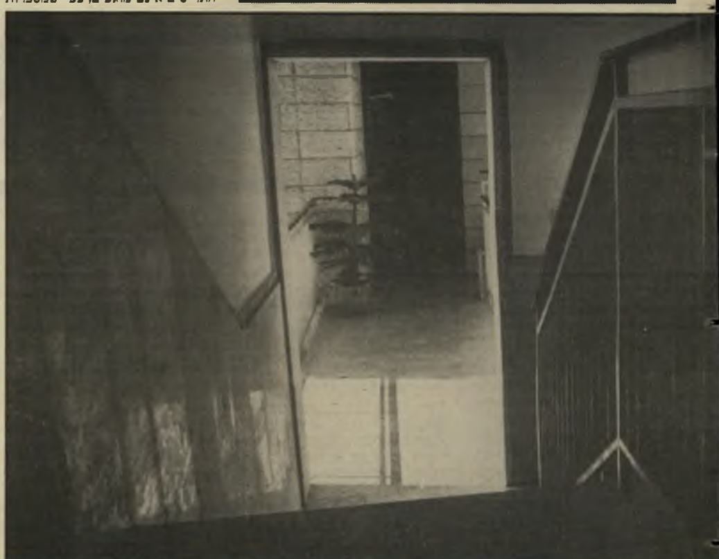
יש רחבה הנראית לעיני השומר ברחוב. את הדלת ניתן לפתוח מבחוץ רק באמצעות הכפתור הסודי בסוכת-השומר. מאחורי דלת זו יש דלת שניה.

זינקנו על המציאה. דוידוביץ חטפה את העוגה ואילו לאה בגין סגרה מאחוריה שתי דלתות ככרות. למעלה הסתבר, שלא ניתן לדבר עם בגין בטלפון. השומר ממש התחלחל מהאפשרות. למעלה גם קיבלנו אישור לכך שלא ניתן להיכנס לדירה, ללא לחיצה על כפתור כלשהו, עלידי השומר. השומר אינו לוחץ בלי אישור