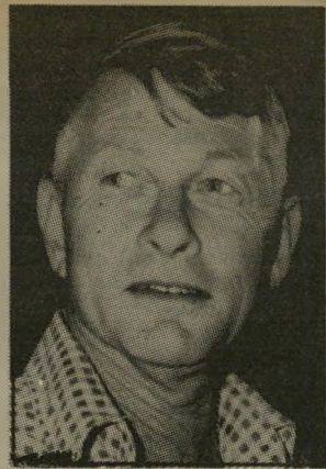
הוקר ארן אשה הובאה לתפקיד

בצורה עדינה רומז מובארכ ישראל שאינו מאמין לה. רק כאשר יוסכם על הבוררים, יוכל שימעון פרס להמשיך בלוחהטיסות שלו זה לא נעים, אמר אליהו בן-