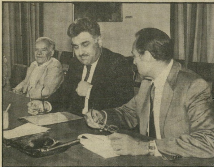
ניסים בין מודעי ושמיר שריר ופת הם רק הפסאדה...

יום שלישי בשבוע מתקיים במישרר-האוצר תידרוך לעיתונאים מטעם אחר מראשי-האגפים. העיתונאים לא הבינו מדוע יש צורך בתידרוך שבועי, ולא עם השר. עוד אחת משיטות-עבודתו של ניסים: לתת לכל אחד מאנשיו לדבר עם העיתונות באופן גלוי ביותר, ובכך להוציא את עוקץ ההדלפות.