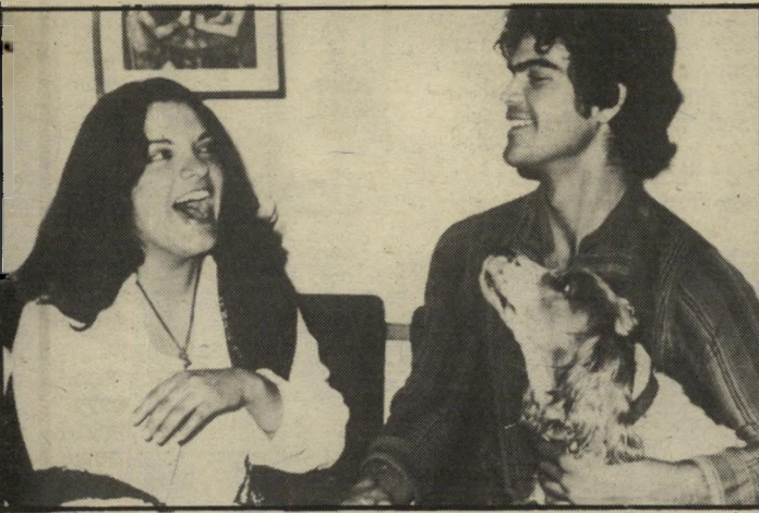
שחקן עבאס וידידה מחוג התיאטרון "אני משהו מיסטריוזי..."

שרוצות להיות בצל אנשים ידועים. עד כאן. על הבדידות הוא כותב: "חורתי לילה לבדי בורד / אנס אותי הלילה אחרי שנים רבות / התבלבלתי, נגזרתי לחתיכות / נהפך העולם וצחקו הדרים / אלוהים התרגו בכסאו / קחיני אלייך / היח כיבה את אורו. וכן, אמרה לי אשוב באחד הימים, כאשר יבוא האביב / וישבתי להסתכל עליה כילד אומלל / נעלמה לי התיקווה וברחו לי הימים / נשארתי בורד בקור."