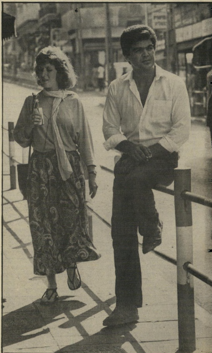
עבאם ברחוב (משמאל: עוברת-אורח)

כשהיא צובטת לגבר ברחוב — זה לא מעשה מגונה!