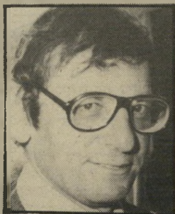
גילון גרביים אדומים

אמריקאי בשם ג'ון אוואנס נכנס למונית בניו יורק ומצא תיק על ריצפת המכונית. הוא החליט שלא למסור אותו לנהג, מפני שלא סמך עליו, ולקח את התיק עימו.