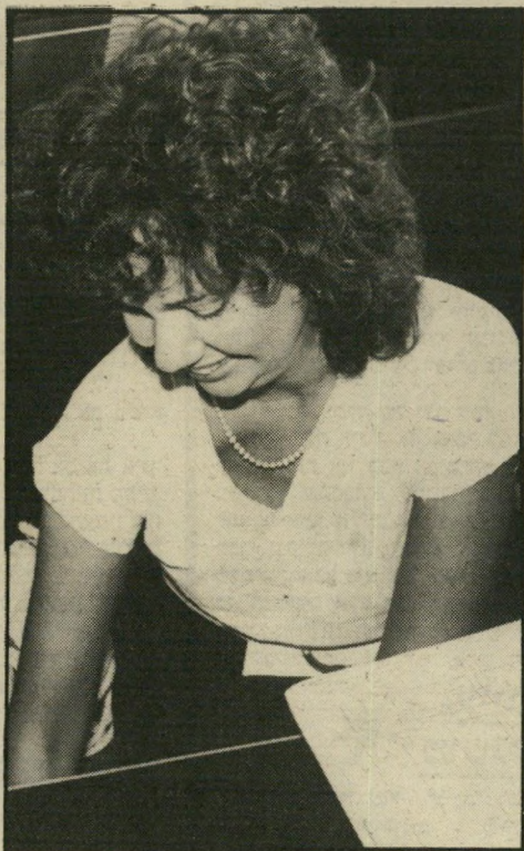
תובעת חן טביעת-האצבע קובעת