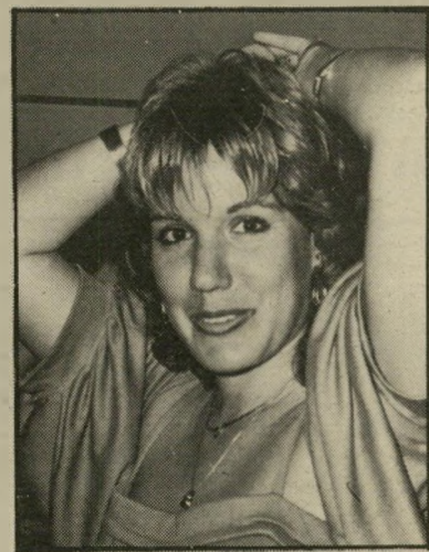
מראיינת ברק סקופ

אך הופיע הגליון האחרון, ובו החלק הראשון של הראיון, והטלפונים החלו מצלצלים. סוכניות-הידיעות הבינלאומיות המטירו עלינו שאלות. איך נערך הראיון? מתי? היכן? בארץ רעדו אמות הסיפים בכמה מוסדות. עיתונאים בעלי-חוש הבחינו מייד שוהו ראיון אותנטי. רק עיתון אחד — הצהרון חדשות — פירסם את השמועות האוויליות שהופצו עליי. גורמים מסויימים, כאילו קרה משהו לא-כשר, כאילו נערך הראיון באמצעות פורץ-הדין, או באמצעות המיטפחה. ועוד גרסות מטופשות. באחד הימים בוורא יהיה באפשרותנו לגלות איך נערך ראיון חסר-תקדים זה. זה יהיה סיפור גדול. בינתיים אנחנו כבולים עליי החובה שלא לגלות מקורות-מידע. אני יכול לומר כיום רק זאת: זהו ראיון