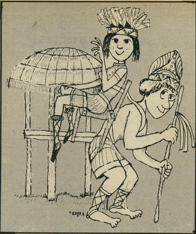
שבט האינדיאני בטייפה - וקפיצות בסיגנון להקת כרמון

לאכילה. מלבד נחשים, אפשר להזמין כמוכן גם צביענק, קרוקודילים ושאר זוועות, שתוך דקות אחרות וטיפולם המסור של בעלי הדוכנים הופכים למאכליתאווה. בתור סוכריות מוכרים רוכלי המקום: עיני צפרדעים, רגלי תמנונים מסוכרים ושאר ממתקים. ממש סמוך לשוקי הנחשים תוכלו