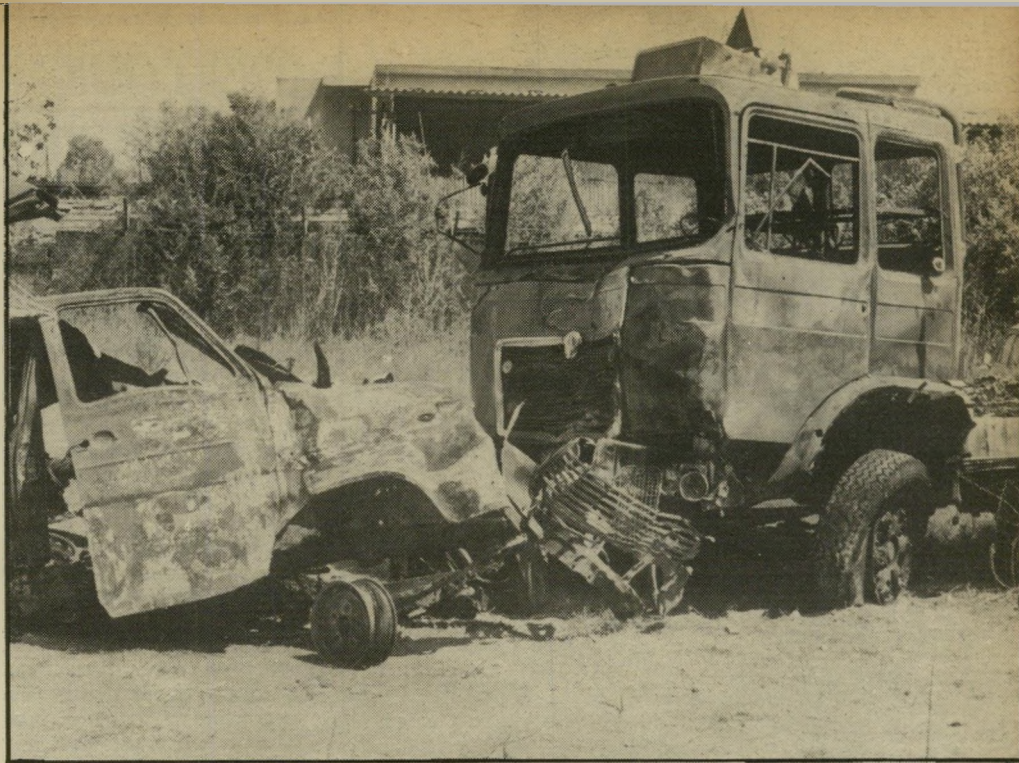
עפולה, לצורך שיחזור רגע התאונה. את מכונית הטרוניט (משמאל), שבה נהרגו ילדי הפצצה, נאלצה המישטרה לשחזר מהחלקים הרבים שנמצאו במקום.

נכון, אין צורך לבדוק. אפטר פשוט לקבוע שמישהו "מסוכן" וחסל. דוגמה זו בלבד מעמידה באור נוגה את כושרה של המישטרה להגיע למי צוי חקירותיה בגלל-התאונות הפוקד את הארץ בשבועות האחרונים.