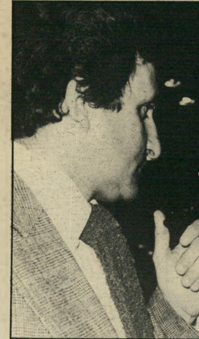
א"ב יהושע מסביר עניין לידיד

„בריהניסוח המובהק" שלנו התקרבה הסיפרות העברית קצת יותר, לא, לא להתפייסות לאומית. גם לא לבולגריה. אולי רק כדי שתי אצבעות מצידו.