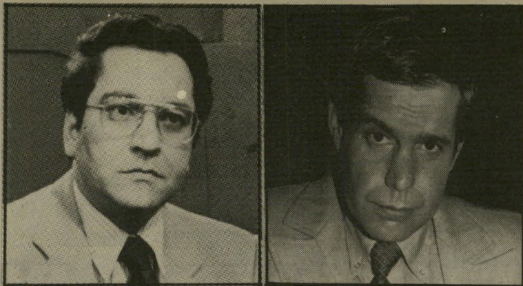
מועמד אחימאיר ליוכד