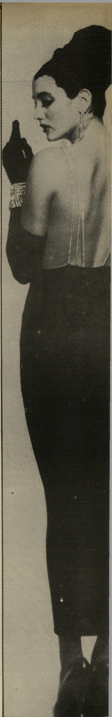
צמודה מבד שחור: מא-חור בסיוגון חצאית צרה ומלפנים עד גובה החזה.