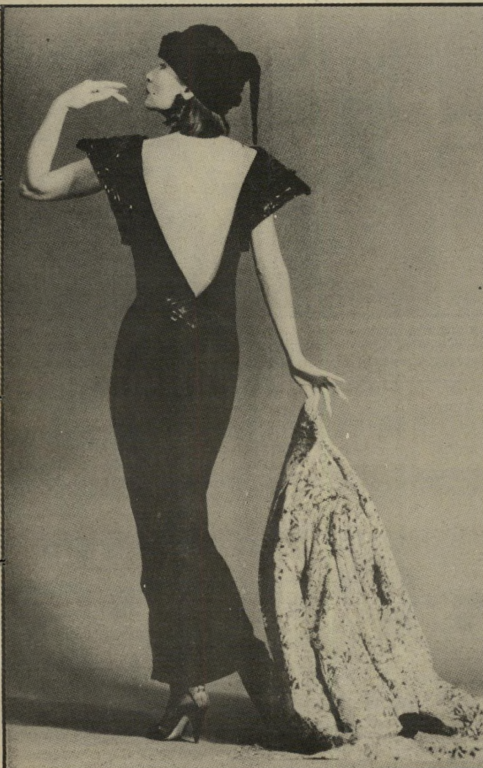
דמיון פתוח הזדמנות-פז לחשיפת הגב בצורת וי עמוק, המש-איר עדיין מקום לדמיון. השרוול קצר, הכתפיות מודגשות ומאייטים רבים מקשטים את השמלה השחורה והאלגנטית.