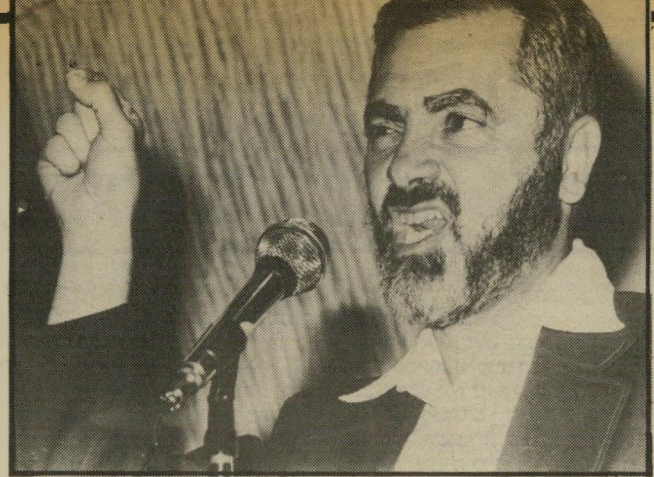
הוא בעל נטייה חזקה להרס עצמי

קטנוני וקפדן. על-פי הניתוחים, כהנא לא מושפע מרגשות. מצד אחד יש בו נטיות למרעים מדויקים ולמחשבה לוגית. מצד שני הוא קטנוני וקפדן מדי. יש בו דחף כפייתי לשלמות, כפי שהוא מבין אותה. מחשבתו מאוד מהירה. קל לו להתבטא, אך אפשר לראות אצלו הפרעות בריכוז. מאוד אינטואיטיבי. בגלל רגישות-יתר ודי