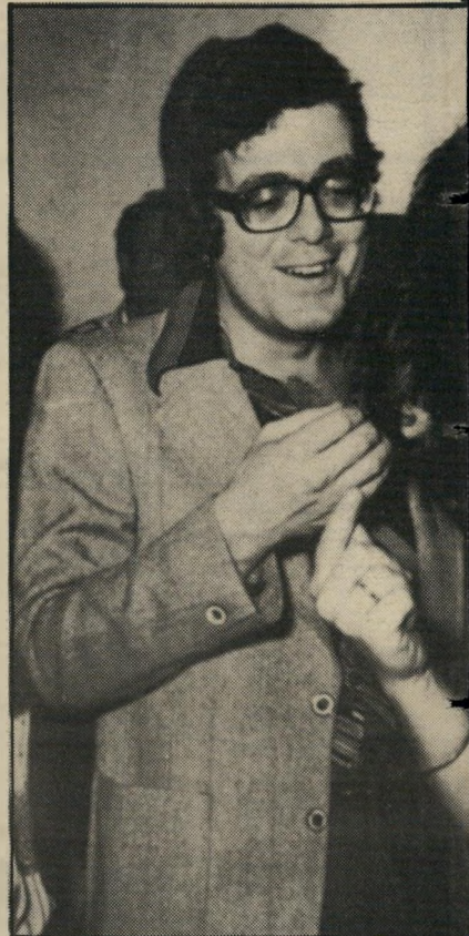
ישראל ברוך אלה מהחננויות

תם סיפור הפרופסורים שיש להם רומאנים גלויים. מי שמנהלים רומאנים סודיים בחדרי חררים לא לקחו חלק בדיווח שלי, אבל זה לא אומר שהאהבות שלהם פחות בווערות.