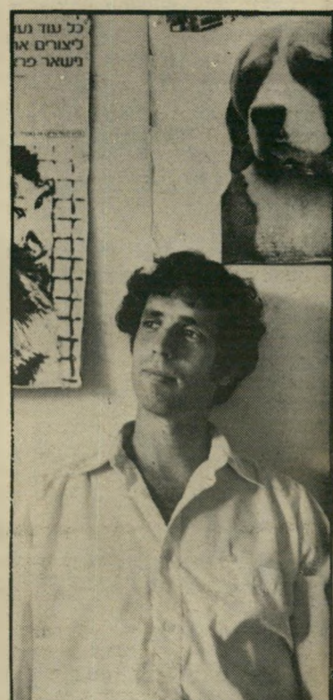
צימחוני יעקובוביץ וגם עצבות. דיכאון וחוסר-שינה

וכמה זמן לוקח כל הטיפול עד לאישור הסופי? כאכ"א מחכים שיצי