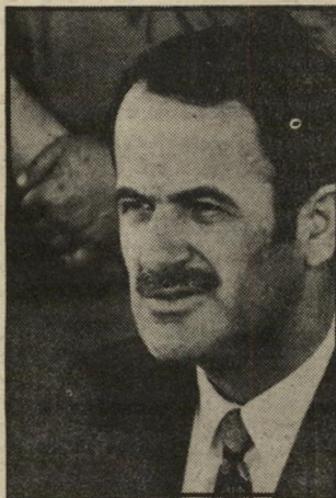
אסד עם אמל נגד אש"ף

במחנות הפליטים בלבנון חיים מאות אלפי פלסטינים בצל של סכנת-שואה. מנוי וגמור עם ראשי המארגנים במדינה לגרש אותם, ואם יש