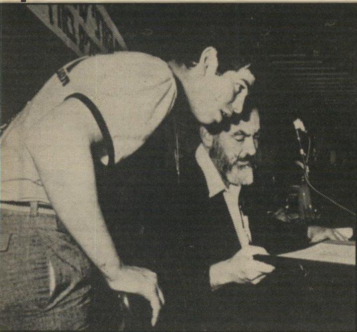
צרפתי עם המנהיג

לכך לא ציפיתי. במשך שנה הייתי עבד של כהנא, ושירתו אותו 24 שעות ביממה. שום דבר אחר לא עניין אותי. היכרתי אותו כשהייתי כעצרת-עם בהשתתפותו, והרברים שלו מצאו חן בעיניי. הייתי בטוח שהוא יפתור את