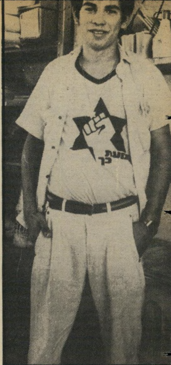
פעיל צרפתי. אני יושב ורועד!

כהנא מלגלג על הספרדים ובו להם. כל ההנהגה בתנועה היא אשכנזית, למרות זה שרוב המצביעים הם ספרי-דים. סמכ-להתנועה, שהיה ספרדי,