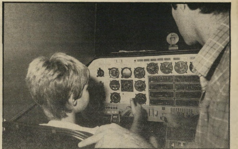
ילד בתוך הסימולטור

הטיס וחברת-התעופה, המאשרת שהוא קיבל תידרוך טיסה ואף הטיס מטוס מעל ירושלים. התעודה הזאת היא החפץ השמור ביותר בביתנו מאז השבוע שעבר.