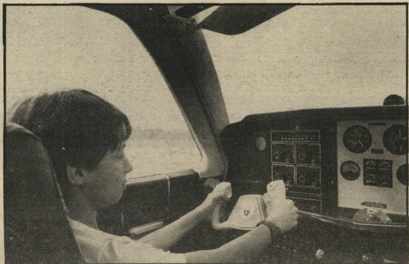
ילד בתוך המטוס

מי שיש לו ילדים (אולי גם ילדות) ויש לו גם 77 שקל ורצון לראות את ילדיו מקייעים לשמיים, בגוף ובנפש, שיקח אותם לשרה-התעופה עטרות, ישתה קפה ויביט בפלא.