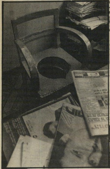
ולא מאף אחד אחר. מה בעצם מחפשים האנשים? קצת יחס חם, מילה טובה והתייחסות רצינית לדיבורים שלהם.

הוא חשב וחשב כיצד אפשר לפתור את הבעיה המכאיבה, ותוך כרי מחשבה הגיע בוקר אחד לאזור דרום-תל-אביב כשהוא רכוב על הקטנוע שלו. שם, במיגרש הריק, עמד לפניו הפתרון