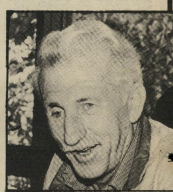
השר נחמקין להפלות אותם!

● זאת אומרת, הזעזוע היה כשבאתם לארץ? ● איסה היית בזמן ההפגנה הגדולה? בארץ. זה היה הרגע שאמרתי לעצמי שיש תיקווה, שיש איוושה נקודת-אור — הרגע של ההפגנה הזאת. ● לא היה לך פיתוי ללכת לשם? לא? ● להפגנה. הייתי בהפגנה. אני אומר שזה היה בפירוש רגע של איוושה נקודת-אור בשבילי. עמדנו שם, ואמרתי שיש סיכוי, בתוך כל ההתרחשות, קורה משהו טוב, משהו נולד. ● זאת אומרת, הזעזוע היה כשבאתם לארץ? ● איסה היית בזמן ההפגנה הגדולה? בארץ. זה היה הרגע שאמרתי לעצמי שיש תיקווה, שיש איוושה נקודת-אור — הרגע של ההפגנה הזאת. ● לא היה לך פיתוי ללכת לשם? לא? ● להפגנה. הייתי בהפגנה. אני אומר שזה היה בפירוש רגע של איוושה נקודת-אור בשבילי. עמדנו שם, ואמרתי שיש סיכוי, בתוך כל ההתרחשות, קורה משהו טוב, משהו נולד. ● זאת אומרת, הזעזוע היה כשבאתם לארץ? ● איסה היית בזמן ההפגנה הגדולה? בארץ. זה היה הרגע שאמרתי לעצמי שיש תיקווה, שיש איוושה נקודת-אור — הרגע של ההפגנה הזאת. ● לא היה לך פיתוי ללכת לשם? לא? ● להפגנה. הייתי בהפגנה. אני אומר שזה היה בפירוש רגע של איוושה נקודת-אור בשבילי. עמדנו שם, ואמרתי שיש סיכוי, בתוך כל ההתרחשות, קורה משהו טוב, משהו נולד.