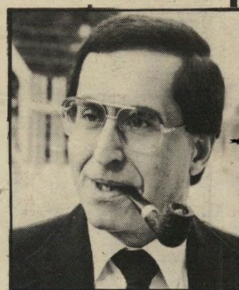
השר שחל שיתקתי את אריק!

רק השבוע גילה את הנייר אחר מעוזי השר. הוא נבהל. מיסמך כליכוד חשוב מתגלגל בלישכה, והשר אינו יודע על כך! המיסמך הונח בבהילות על שולחנו של השר, באיחור של שנה, והעורר הנוכח ביקש לדעת מה לעשות בו. ● לפרסם את הביזיונות! עסקים בליכוד, שעינינו היטב במיסקין, טרם החליטו איזה שימוש לעשות בו. הם מהססים עדיין אם לעורר סביבו פרשה חדשה ומשבר, לנופף בהתרגנות הכיתית של המערך, ולאיים בפירוק הממשלה — דבר אשר עלול לשבש את הרוטציה