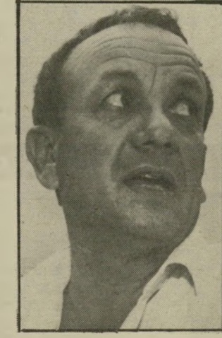
מועמד סגן עסקן אפרורי שהפתע