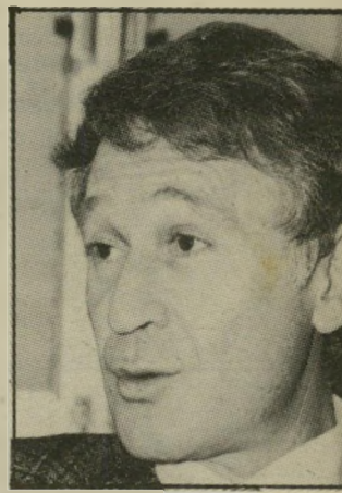
מועמד ברמל לשון קשה