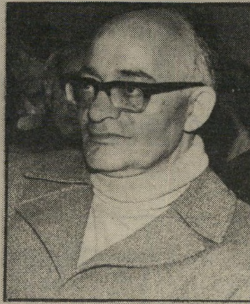
מזכיר בורשטיין מי שלם?

במיסדרונות הטלוויזיה אמרים כי לסירוב יש סיבה אחת: מאז שמבקר המדינה מתח ביקורת על ריבוי הנסיעות של עובדי הרדיו והטלוויזיה לחו"ל, החליטה הנהלת הרשות להמעיט בנסיעות, עד יעבור זעמן של המבקר.